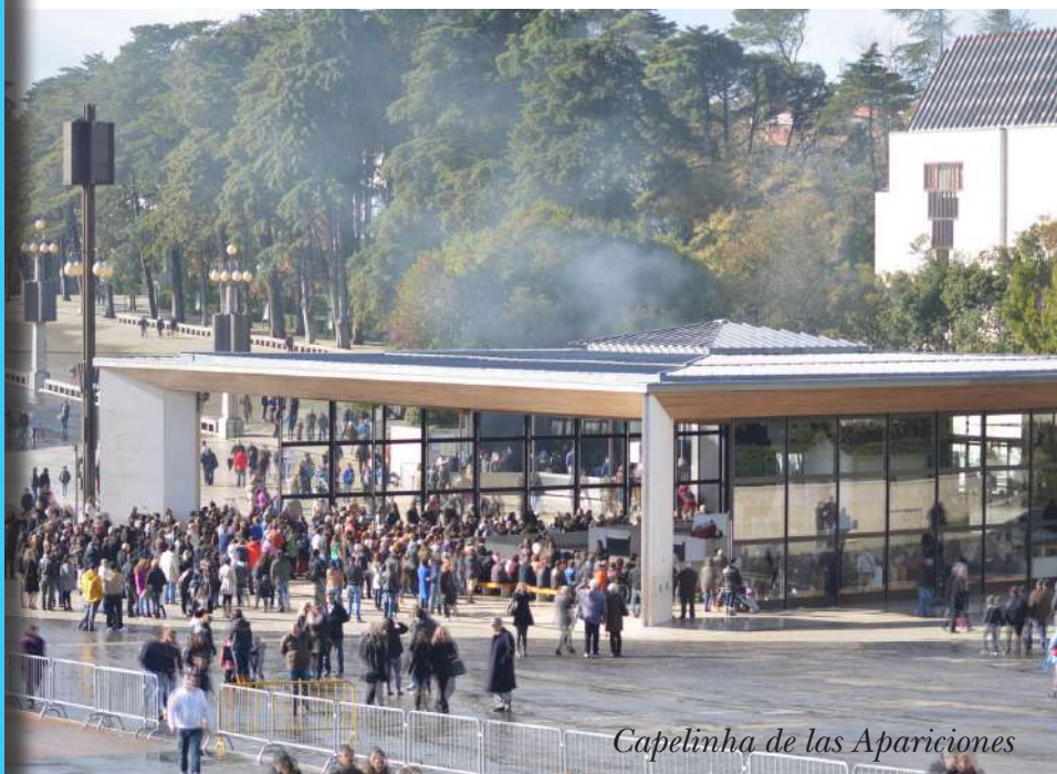
Capelinha de las Apariciones