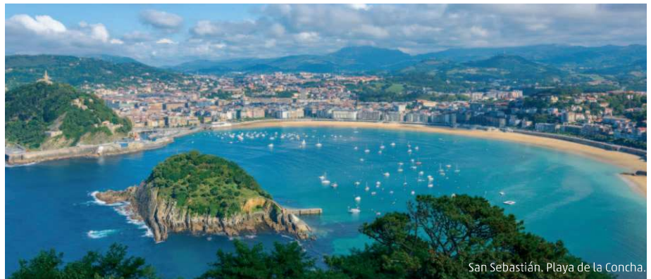
San Sebastián, Playa de la Concha.

Día 1º. ORIGEN - MADRID - VIZCAYA. M.P. Salida desde la terminal a la hora indicada con destino al País Vasco. Se realizarán diversas paradas en ruta, una de ellas para realigar el almuerzo (no incluido). Llegada a Vizcaya; acomodación, cena con las bebidas incluidas y alojamiento en el hotel.